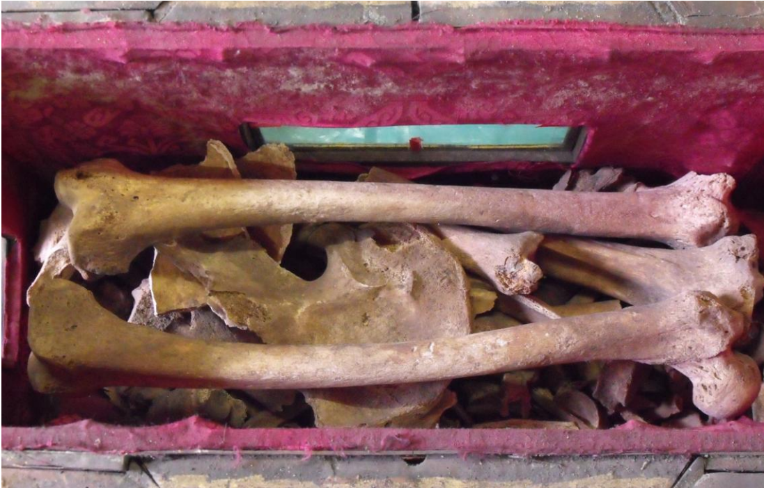
La disposizione originaria delle ossa nell'urna

Sono state rimosse dalla teca, cercando di individuare una eventuale disposizione spaziale intenzionale, anatomica o rituale; si è potuto osservare che le porzioni ossee di minori dimensioni erano sul fondo mentre i femori, quasi integri, insieme all'osso dell'anca di sinistra, anch'esso in buone condizioni di conservazione, erano collocati superiormente. Sembra dunque che nella parte superiore della teca, osservabile dalle finestre poste sui quattro lati, siano state deposte le ossa di maggiori dimensioni, più integre e quindi facilmente riconoscibili.