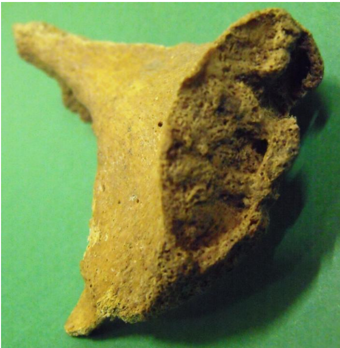
La regione sinfisaria dell'osso pubico con segni di rimodellamento dovuti all'età

Il dato mostra una buona compatibilità con quello riportato dalle notizie storiche di 70-75 anni (Mariangeli, 1974, 2004), considerando che l'anno della nascita e della morte non sono noti con sicurezza, ma ricavati per comparazione con accadimenti contemporanei.