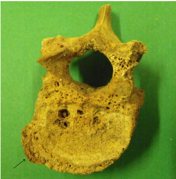
Vertebra toracica con segni di osteoartrite

Per quel che riguarda i corpi vertebrali si notano segni diffusi di osteoartrite in molte vertebre probabilmente dovuti all'avanzata età del soggetto in esame.