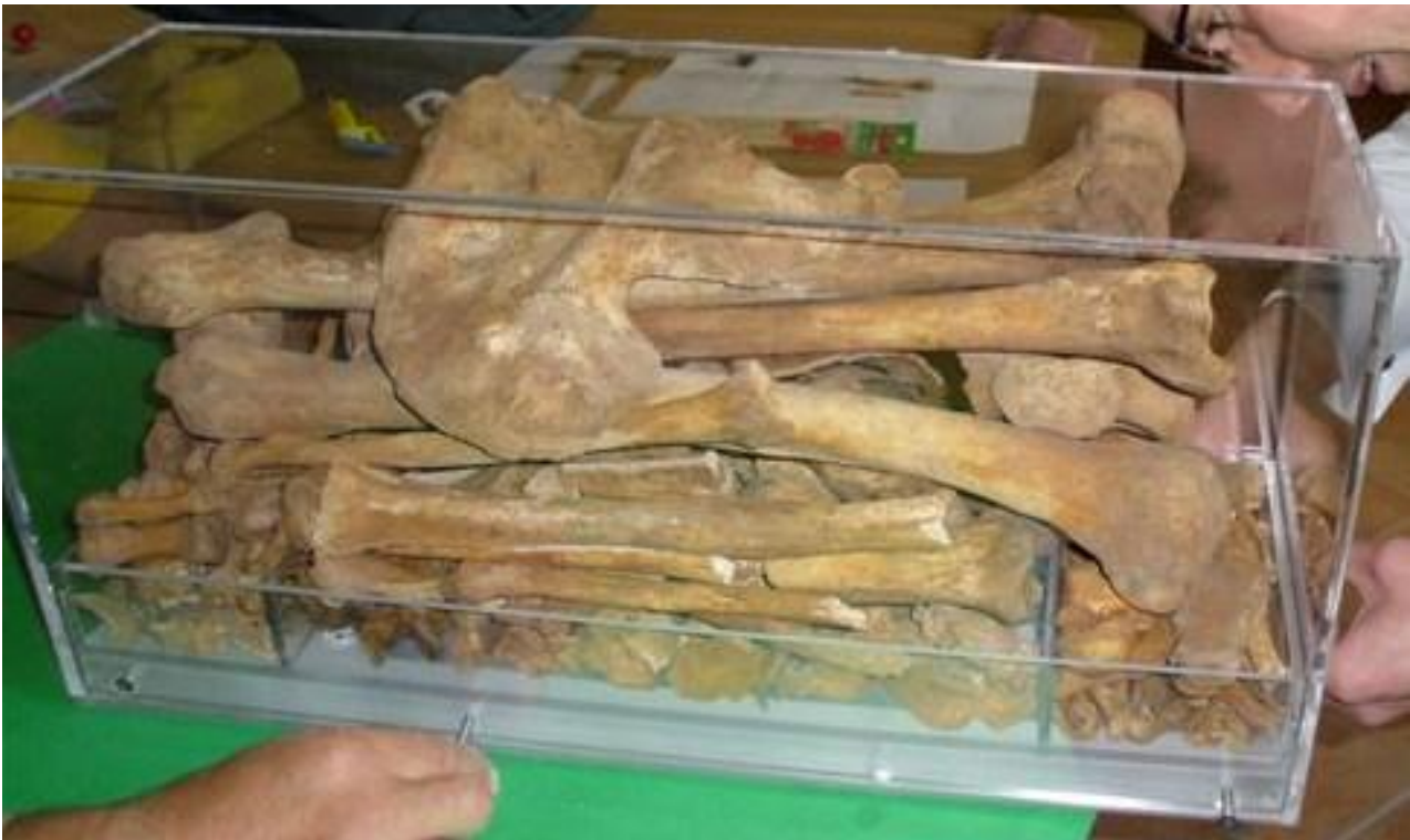
La nuova teca