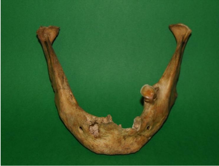
Il mascellare inferiore