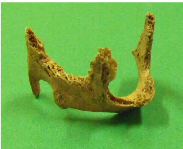
La cartilagine ioidea ossificata

L'età potrebbe anche essere la causa dell'ossificazione della cartilagine tiroidea: Cerny (1983) e altri autori ricollegano infatti il fenomeno all'avanzare degli anni.